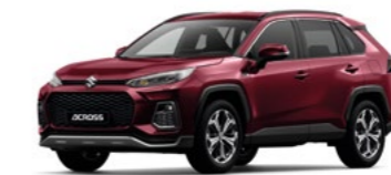
Sensual Red Mica Metallic