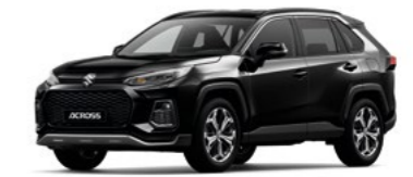
Attitude Black Mica Metallic