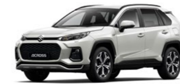
Platinum White Pearl Metallic