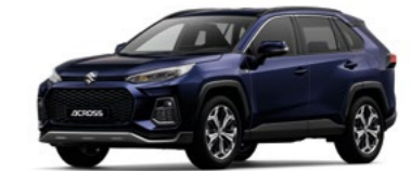
Dark Blue Mica Metallic